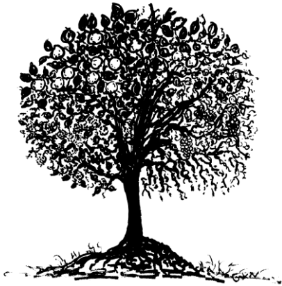
Der Baum – ein Abbild unseres Lebens: WERT-VOLL zu jeder Jahreszeit...

Der Anteil von Menschen in der dritten und vierten Lebensphase steigt stetig an. Gleichzeitig wird das Spektrum der Seniorinnen und Senioren in Bezug auf Alter, Interessen, Fähigkeiten und Bedürfnissen immer breiter. Dies bedeutet für die Kirche sowohl eine Bereicherung als auch eine Herausforderung.