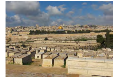
Blick auf den Tempelberg

Jerusalem : Auffahrt zum Ölberg mit wunderbarem Panoramablick über die Heilige Stadt. Wir spazieren über den Jüdischen Hauptfriedhof und entlang der Palmsonntagsprozession zur Kapelle Dominus Flevit und hinunter zum Garten Gethsemane mit uralten Olivenbäumen und der „Kirche aller Nationen“ mit der Verratsgrotte. Es geht dann zum Tempelberg. An der Tempelmauer erleben wir Bar-Mitzwa-Feiern . Besuch des Tempelplatzes mit dem Felsendom und der El-Aksa-Moschee ; Wieder in der Altstadt geht es zum Teich Bethesda mit der Kreuzfahrerkirche St. Anna und ihrer herrlichen Akustik. Wir folgen der Via Dolorosa zur Grabeskirche ; Rückfahrt ins Hotel.