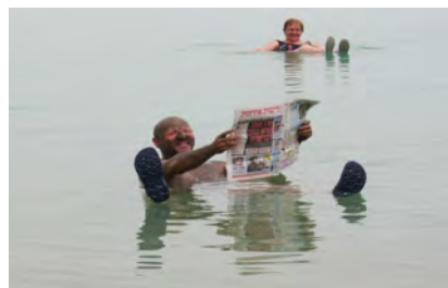
Im Toten Meer – echt oder gestellt?

Freie Zeit am Toten Meer zum Baden; kleine Wanderungen möglich, fakultativ Jeoptour durch die Salzwüste.