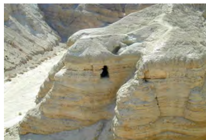
Qumranhöhle und Schriftrolle

Fahrt nach Ein Gedi , Wanderung im Naturschutzgebiet und Aufstieg entlang der Wasserfälle . Fahrt nach Qumran zur ehemaligen jüdischen Gemeinschaftssiedlung am Toten Meer: Blick auf die Höhlen, in denen die berühmten Schriftrollen gefunden wurden.