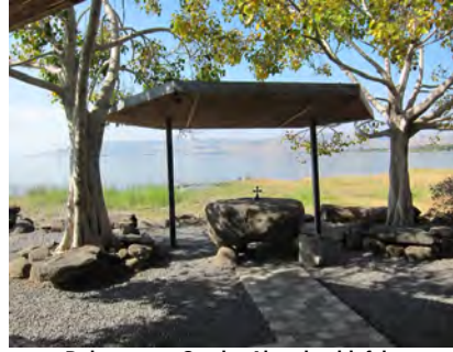
Dalmanuta - Ort der Abendmahlsfeier

Fahrt nach Tabgha , einer kleinen Kirche mit den schönsten Mosaikböden aus dem 4. Jhd. am Ort der biblischen Brotvermehrung. Anschl. Gottesdienst mit Hl. Abendmahl in Dalmanuta direkt am See.