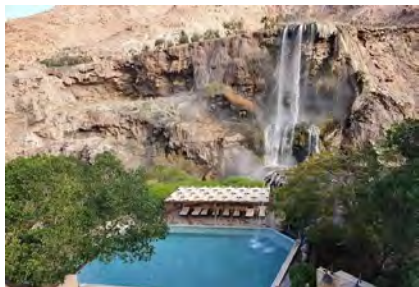
Thermalquellen Ma'in Hot Springs

Besuch der St. Georgkirche in Madaba mit dem berühmten Mosaik, der ältesten Landkarte vom Heiligen Land .