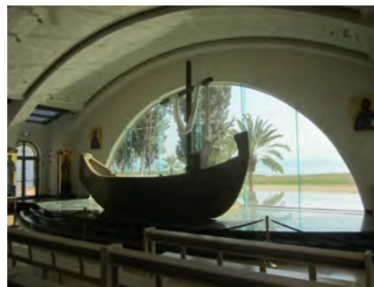
Neue Kirche in Magdala mit Jesusboot

Auffahrt zum Berg der Seligpreisungen , dem Ort der Bergpredigt, Besuch der Kirche der Seligpreisungen, Wanderung über Wiesen und Felder zum See Genezareth . Besuch des Yehudiya Forest Nature Reserve mit dem Mes-hushim-See mit Bademöglichkeit.