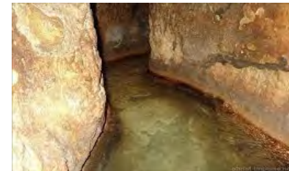
Hiskija-Tunnel in Jerusalem

Bethlehem : Wir besuchen die Geburtskirche mit der Geburtsgrotte und die Hirtenfelder mit der Engelskapelle . Es geht ins neue Jerusalem : Besuch des Israelmuseums mit der Ausstellung der Qumranfunde und einer Jerusalem-Miniatur ; Fahrt zur Menorah vor der Knesseth , dem israelischen Parlament. Besuch der Gedenkstätte für die Opfer des Nationalsozialismus, Jad Vashem , mit dem Tal der Gemeinden .