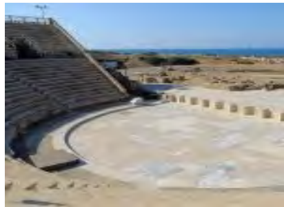
Cäsarea am Meer mit vielen Ausgrabungen

Fahrt entlang dem Mittelmeer nach Cäsarea am Meer , der schönsten Stadt zur Zeit Herodes d. Gr., Haupthafen der Römer und Kreuzfahrer, Besichtigung des Amphitheaters. Weiter nach Haifa , der größten Hafenstadt Israels: Templerhäuser , Blick auf den Bahai-Tempel und die Persischen Gärten . Fahrt nach Nazareth : Besuch der Verkündigungsbasilika mit Josephs Werkstattkirche ; weiter zum Besuch des „ Nazareth Village “ - ein Dorf wie zu Jesu Zeiten. Wenn die Zeit es erlaubt, Stopp in Kana (Weinwunder); dann nach Tiberias – 3 Nächte in Tiberias, Hotel Dona Gracia