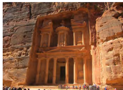
Schatzhaus des Pharao

Petra, biblische Felsenstadt der Nabatäer , Nachfahren des Volkes Neba-