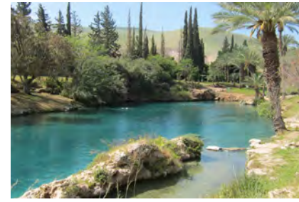
Die Mikve zum Himmel – Bad in Gan Hasloscha

Fahrt durch das Jordantal zur Palmen-oase Jericho , der wohl ältesten Stadt der Welt mit Blick ins Judäische Gebirge. Mit der Seilbahn hinauf ins „ Kloster der Versuchung “, Besichtigung des Klosters; grandioser Blick auf Jericho und das Jordantal. Dann weiter durch das Gebirge und die Wüste hinauf nach Jerusalem , vom Berg Scopus aus haben wir einen ersten Blick auf die Altstadt, Weiterfahrt nach Bethlehem , 3 Nächte im Gästehaus Beit Al Liqua.