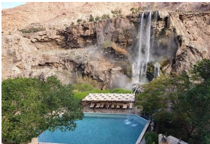
Thermalquellen Ma'in Hot Springs

Besuch der St. Georgkirche in Madaba mit dem berühmten Mosaik, der ältesten Landkarte vom Heiligen Land .