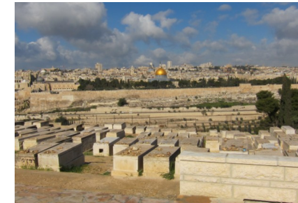
Blick auf den Tempelberg

Jerusalem : Auffahrt zum Ölberg mit wunderbarem Panoramablick über die Heilige Stadt. Wir spazieren über den Jüdischen Hauptfriedhof und entlang der Palmsonntagsprozession zur Kapelle Dominus Flevit und hinunter zum Garten Gethsemane mit uralten Olivenbäumen und der „Kirche aller Nationen“ mit der Verratsgrotte. Es geht dann zum Tempelberg. An der Tempelmauer erleben wir Bar-Mitzwa-Feiern . Besuch des Tempelplatzes mit dem Felsendom und der El-Aksa-Moschee ; Wieder in der Altstadt geht es zum Teich Bethesda mit der Kreuzfahrerkirche St. Anna und ihrer herrlichen Akustik. Wir folgen der Via Dolorosa zur Grabeskirche ; Rückfahrt ins Hotel.