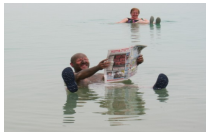
Im Toten Meer – echt oder gestellt?

Freie Zeit am Toten Meer zum Baden; kleine Wanderungen möglich, fakultativ Jeep-tour durch die Salzwüste.