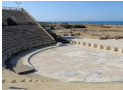
Cäsarea am Meer mit vielen Ausgrabungen

Fahrt entlang des Mittelmeeres nach Cäsarea am Meer , der schönsten Stadt zur Zeit Herodes d. Gr., Haupthafen der Römer und Kreuzfahrer, Besichtigung des Amphitheaters. Weiter nach Haifa , der größten Hafenstadt Israels: Tempel-Häuser , Blick auf den Bahai-Tempel und die Persischen Gärten . Fahrt nach Nazareth : Besuch der Verkündigungsbasilika mit Josephs Werkstattkirche ; weiter zum Besuch des „ Nazareth Village “ - ein Dorf wie zu Jesu Zeiten. Wenn die Zeit es erlaubt, Stopp in Kana (Weinwunder); dann nach Tiberias – 3 Nächte in Tiberias, Hotel Dona Gracia