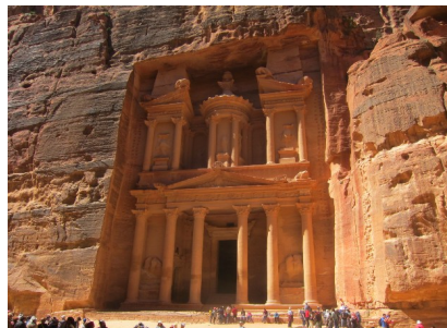
Schatzhaus des Pharao

Petra, biblische Felsenstadt der Nabatäer , Nachfahren des Volkes Nebojoth (1. Mose 25, 12-18; 1. Chr. 1, 29; Jes 60, 7). Die nabatäische Geschichte