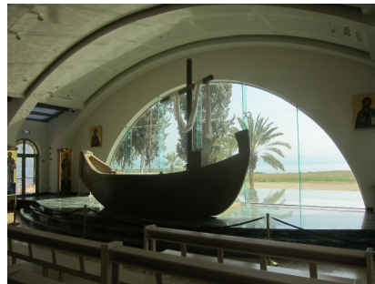
Neue Kirche in Magdala mit Jesuschiff

Auffahrt zum Berg der Seligpreisungen , dem Ort der Bergpredigt, Besuch der Kirche der Seligpreisungen, Wanderung über Wiesen und Felder zum See Genezareth . Besuch des Yehudiya Forest Nature Reserve mit dem Meshushim-See mit Bademöglichkeit.