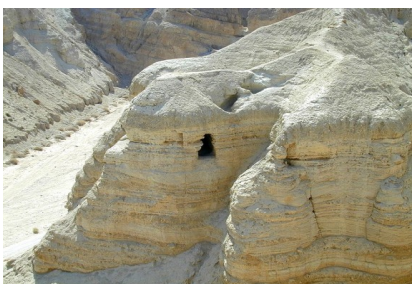
Qumranhöhle und Schriftrolle

Fahrt nach Ein Gedi , Wanderung im Naturschutzgebiet und Aufstieg entlang der Wasserfälle . Fahrt nach Qumran zur ehemaligen jüdischen Gemeinschaftssiedlung am Toten Meer: Blick auf die Höhlen, in denen die berühmten Schriftrollen gefunden wurden.