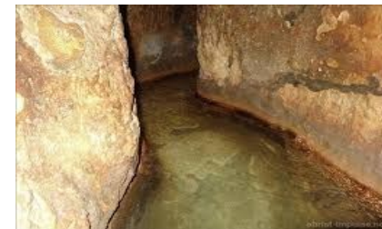
Hiskija-Tunnel in Jerusalem

Bethlehem : Wir besuchen die Geburtskirche mit der Geburtsgrotte und die Hirtenfelder mit der Engelskapelle . Es geht ins neue Jerusalem : Besuch des Israelmuseums mit der Ausstellung der Qumranfunde und einer Jerusalem-Miniatur ; Fahrt zur Menorah vor der Knesseth , dem israelischen Parlament. Besuch der Gedenkstätte für die Opfer des Nationalsozialismus, Jad Vashem , mit dem Tal der Gemeinden .