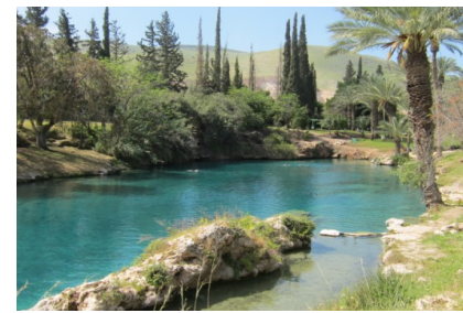
Die Mikve zum Himmel – Bad in Gan Hasloscha

Fahrt nach Süden mit Halt in Beth Alfa , Besichtigung der Synagoge , Zeit zum Baden in Gan Hasloscha , einem kleinen Paradies.