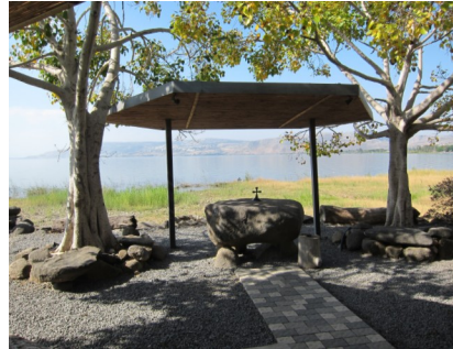
Dalmanuta - Ort der Abendmahlsfeier

Fahrt nach Tabgha , einer kleinen Kirche mit den schönsten Mosaikböden aus dem 4. Jhd. am Ort der biblischen Brotvermehrung. Anschl. Gottesdienst mit Hl. Abendmahl in Dalmanuta direkt am See.